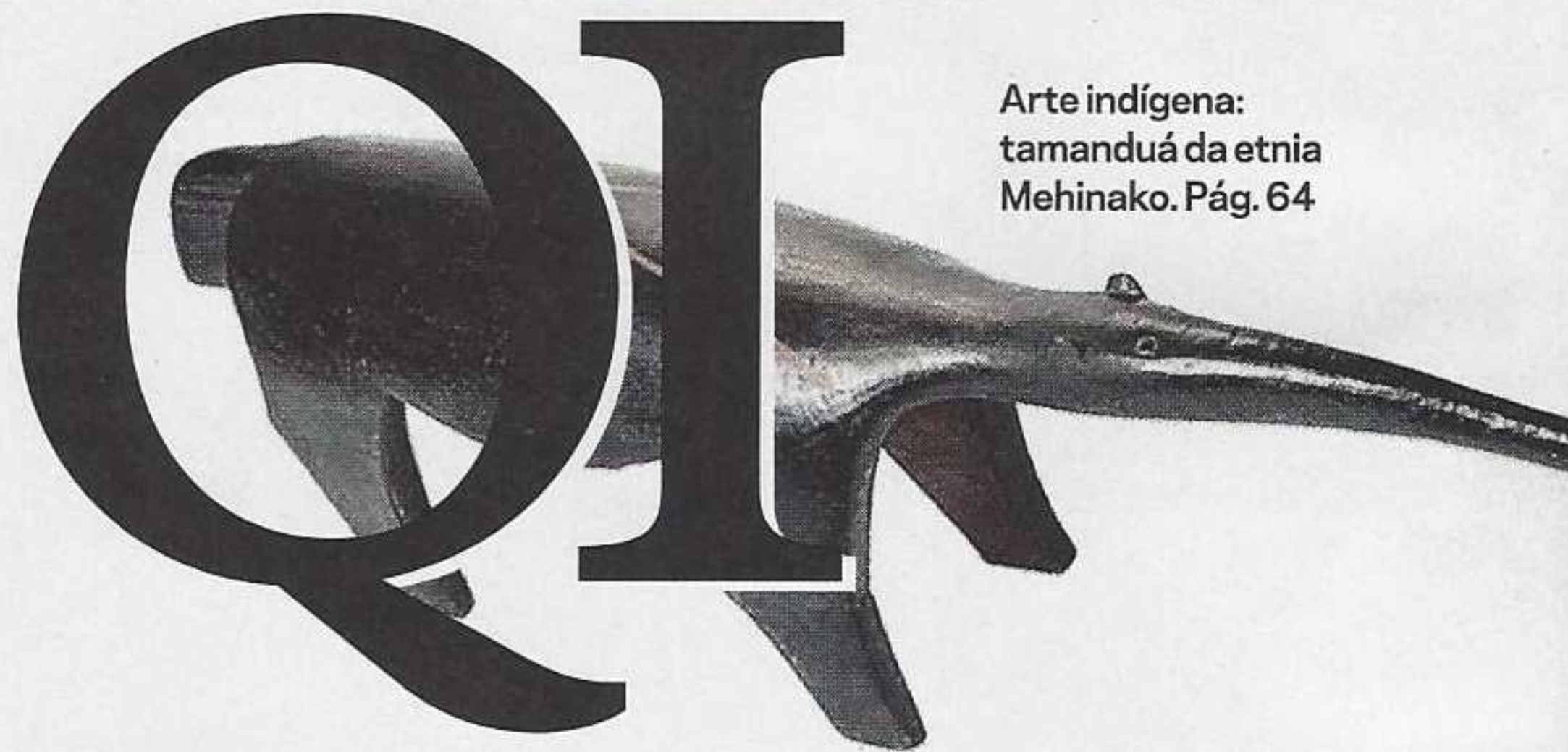
Arte indígena: tamanduá da etnia Mehinako. Pág. 64